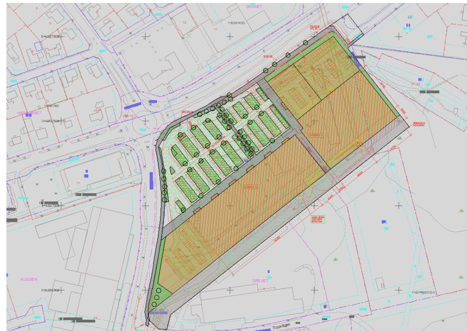
Illustration med möjlig disposition av planområdet.