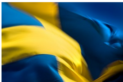
Ansök om nationaldagsfirande hos Polismyndigheten