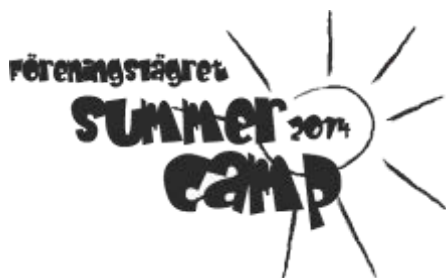
Föreningslägret Summer Camp