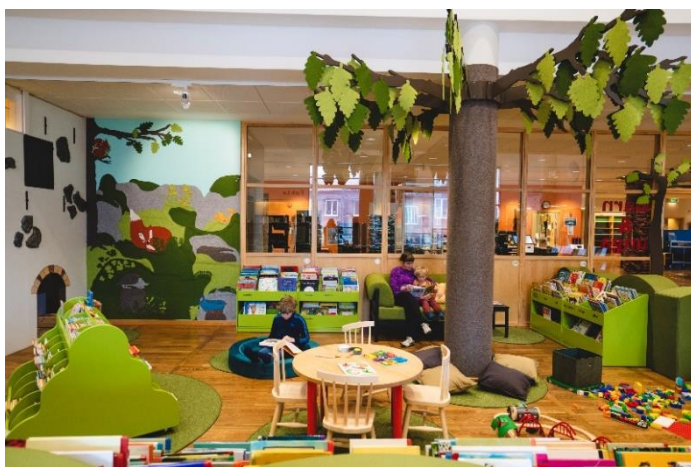
Barnavdelningen på stadsbiblioteket Stärkta bibliotek 2022

Biblioteken står som institution på en stadig grund i det öppna svenska demokratiska samhället. De ska garantera möjligheten till fri information och vara öppna för alla. Som stöd för den enskildes livslånga lärande, vilket blir allt viktigare, spelar de en central roll. Besöken på biblioteken ska ske på lika villkor för alla och tillgänglighet är en förutsättning. Historiskt sett har folkbiblioteken i Sverige stort förtroende bland medborgarna och är fortfarande den mest besökta institutionen.