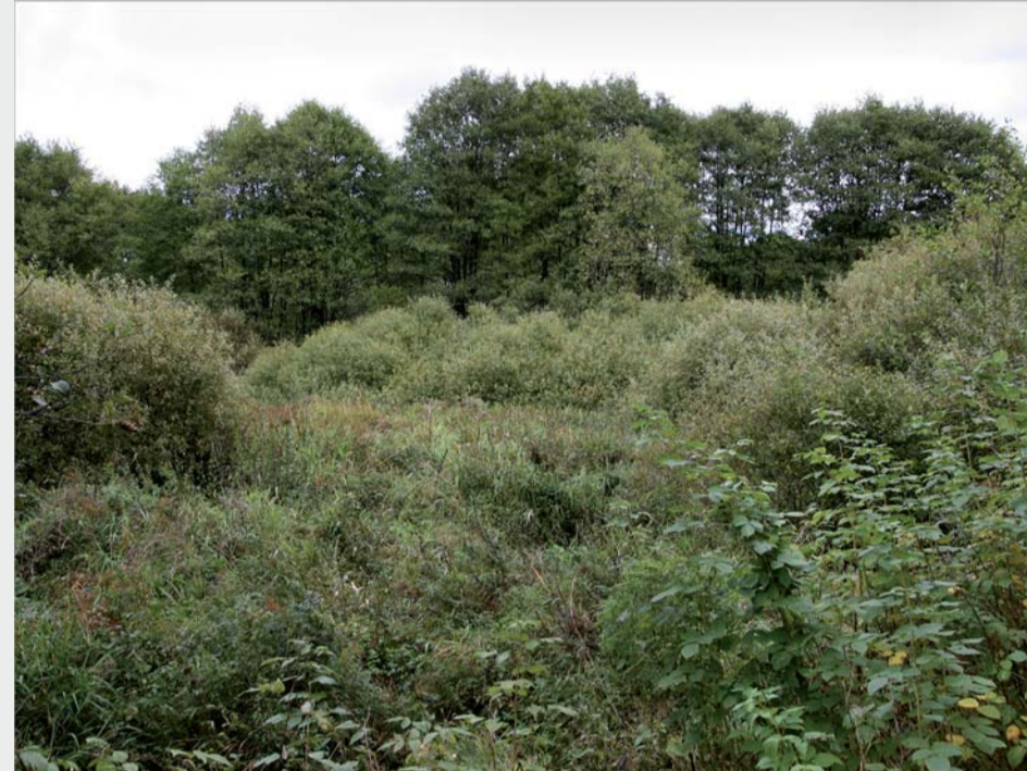
Området innan restaurering.

Hovdalaån svämmar tidvis över detta område. Därför har marken här tidigare nyttjats för höproduktion. En sådan blöt slåtteräng kallas för sidvallsäng. Sedan någon gång i mitten av 1900-talet upphörde ängsbruket och marken växte igen, framför allt med vide och al.