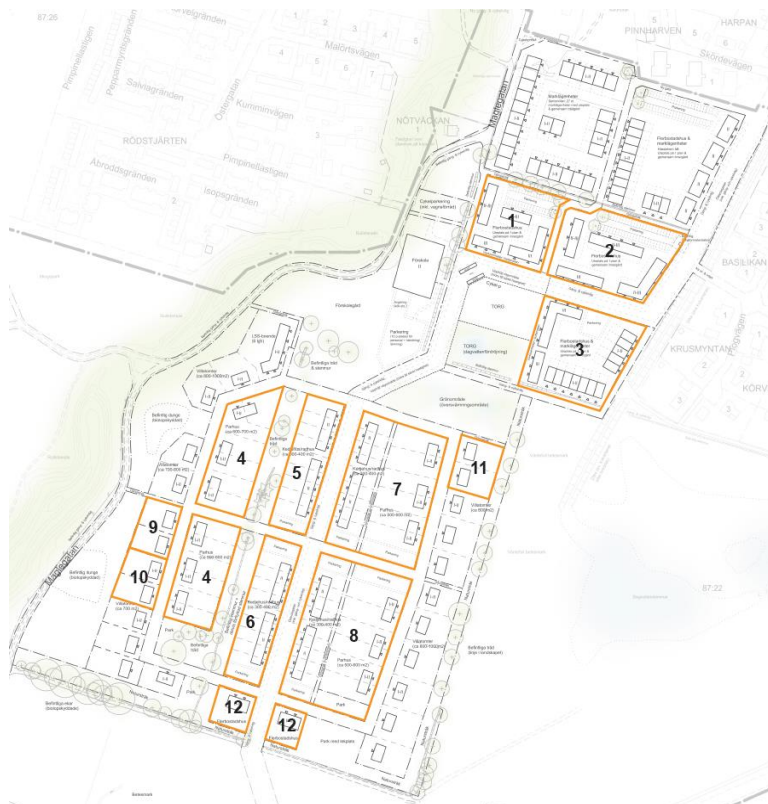
Figur 3 - Bild av indelningen av tävlingsområden.

Vad gäller villatomterna i planområdet är alla tomter, förutom de som ingår i tävlingsområdena 9-11 undantagna från tävlingen. Dessa avser kommunen att sälja genom fastighetsmäklare. De två mest nordliga kvarteren i planområdet är sedan tidigare tilldelade genom option till Seniorvillan och Hässlehem.