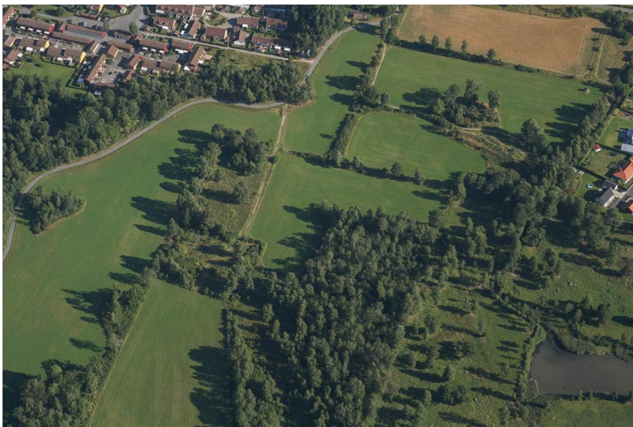
Figur 1 - Flygbild över Björklunda

Tekniska förvaltningen/ Mark-och exploateringsavdelningen