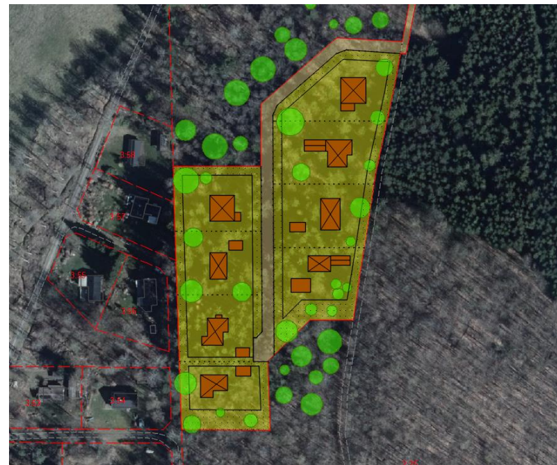
Illustration med möjlig disposition av planområdet.