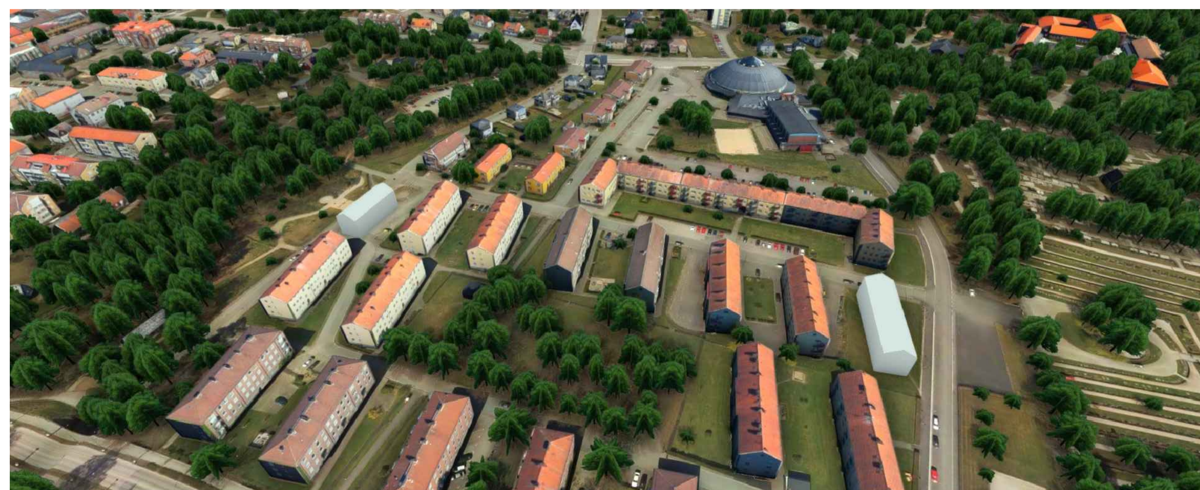
3D-vy över Hagaområdet med nya byggnadsvolymer som möjliggörs med detaljplanen.

Koordinatsystem SWEREF 99 13 30, Höjdsystem RH 2000.