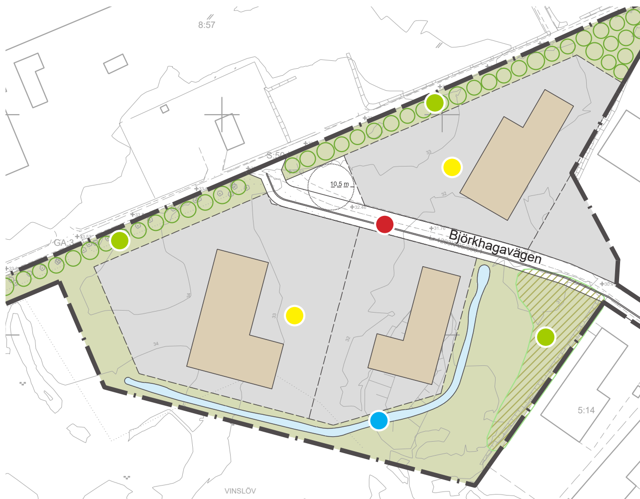
Bild över planförslagets huvuddrag. Obs! Detta är endast en sammanfattning av planförslaget. Planförslaget finns i sin helhet på www.hassleholm.se/dp .