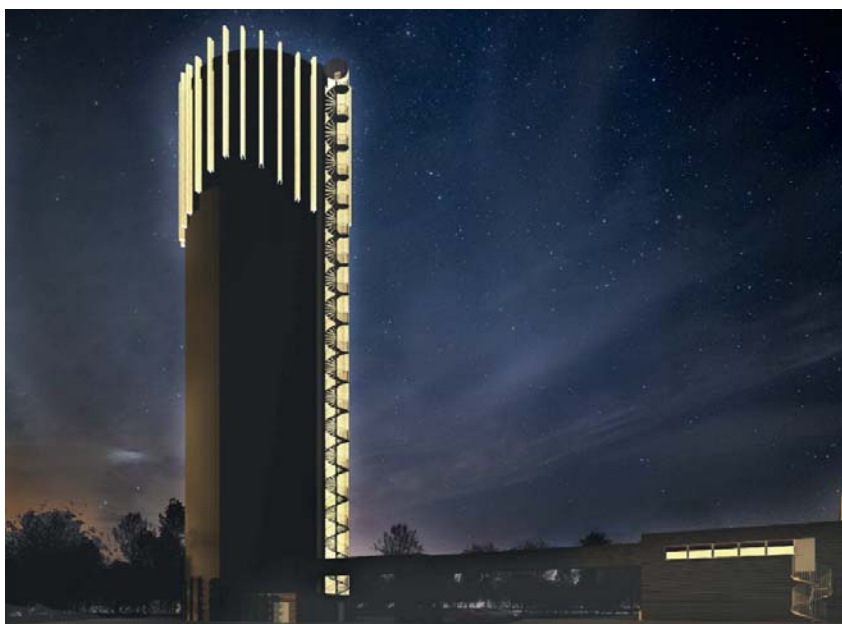
Gestaltningförslag. Illustrationer: Arkitektgården

Planförslaget innebär att det uppförs en ca 60 meter hög och 20 meter bred ackumulatortank. Ackumulatortankens funktion är att lagra överskottsvärme från fjärrvärmeproduktionen och utjämna dygnsvariationerna, vilket utöver en ökad leveranssäkerhet även bidrar till mindre miljöpåverkan.