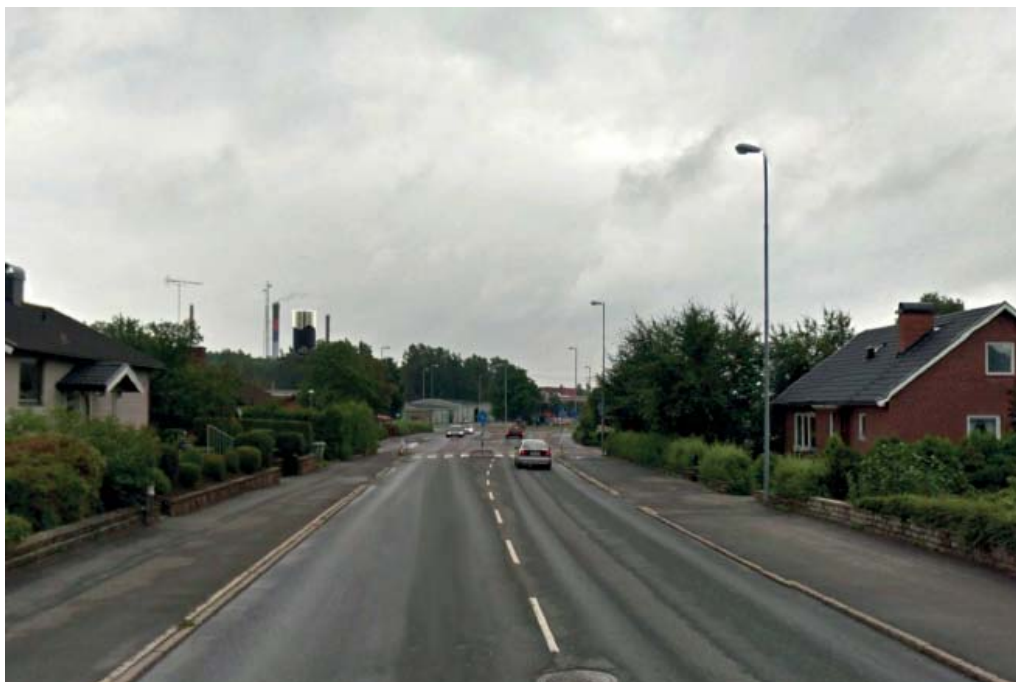
Vy från Norra Kringelvägen