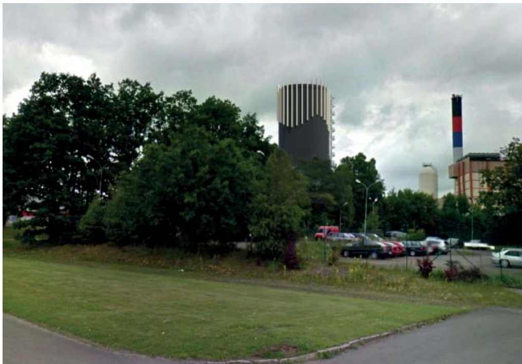
Vy från Industrigatan

Nedan redovisas fotomontage från fyra platser i Hässleholm.