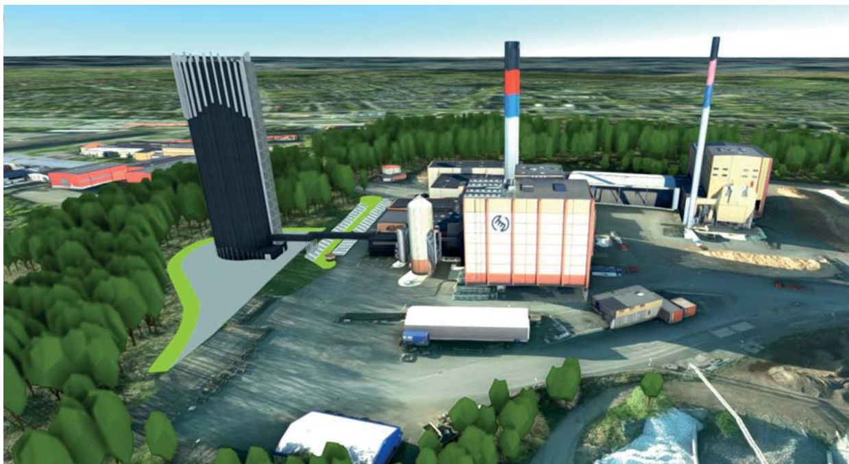
Bild ur 3D-modell