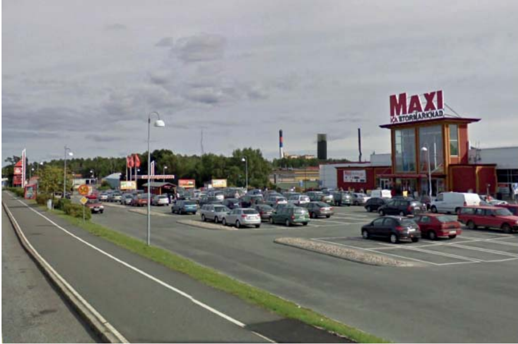
Vy från Stobyvägen