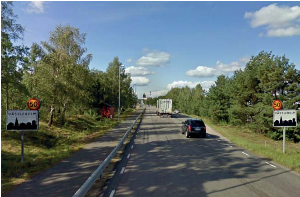
Vy från Industrigatan/infart från väg 23