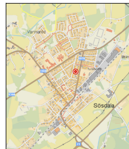
Orienteringskarta över Sösdala