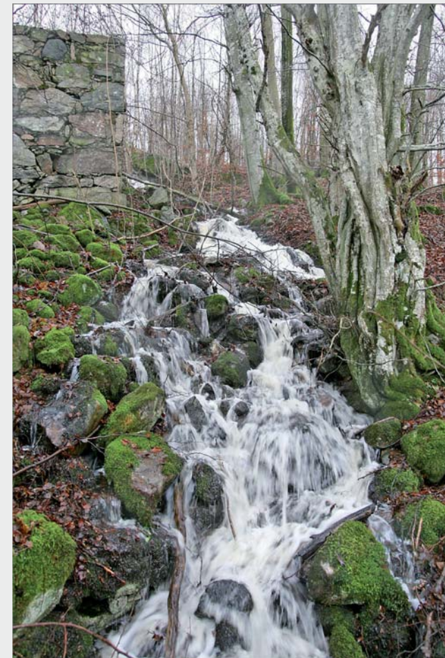
Bäcken restaurerades 2009-2010.