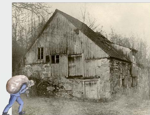
Hovdala tullkvarn, 1920-talet

...slottsfrun ofta kom med specialbeställningar. Då skulle det bakas - åt djuren! För att de skulle värpa eller mjölka bättre.