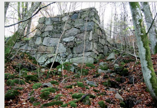
Den torra bäckfåran innan bäckrestaureringen. Lägga märke till den romerska valvbågen. Den bärs upp genom spänningen mellan stenarna.