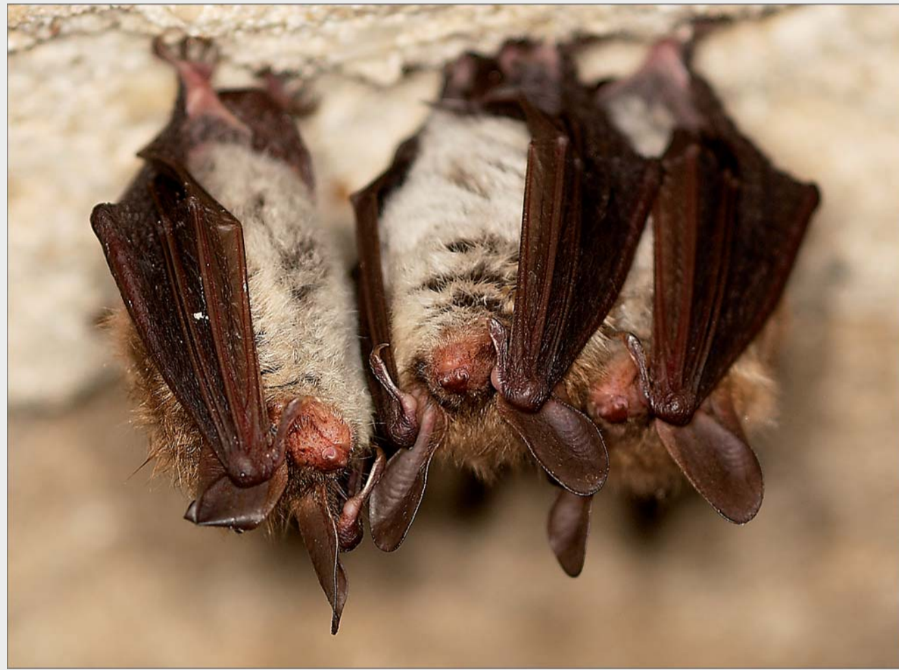
Bechsteins fladdermus anses vara Sveriges mest hotade däggdjur! Arten är utnämnd till Hässleholms kommundäggdjur.

Du befinner dig nu på en av Sveriges bästa platser för fladdermöss. Hovdala naturområde hyser minst 16 av Sveriges 19 fladdermusarter!