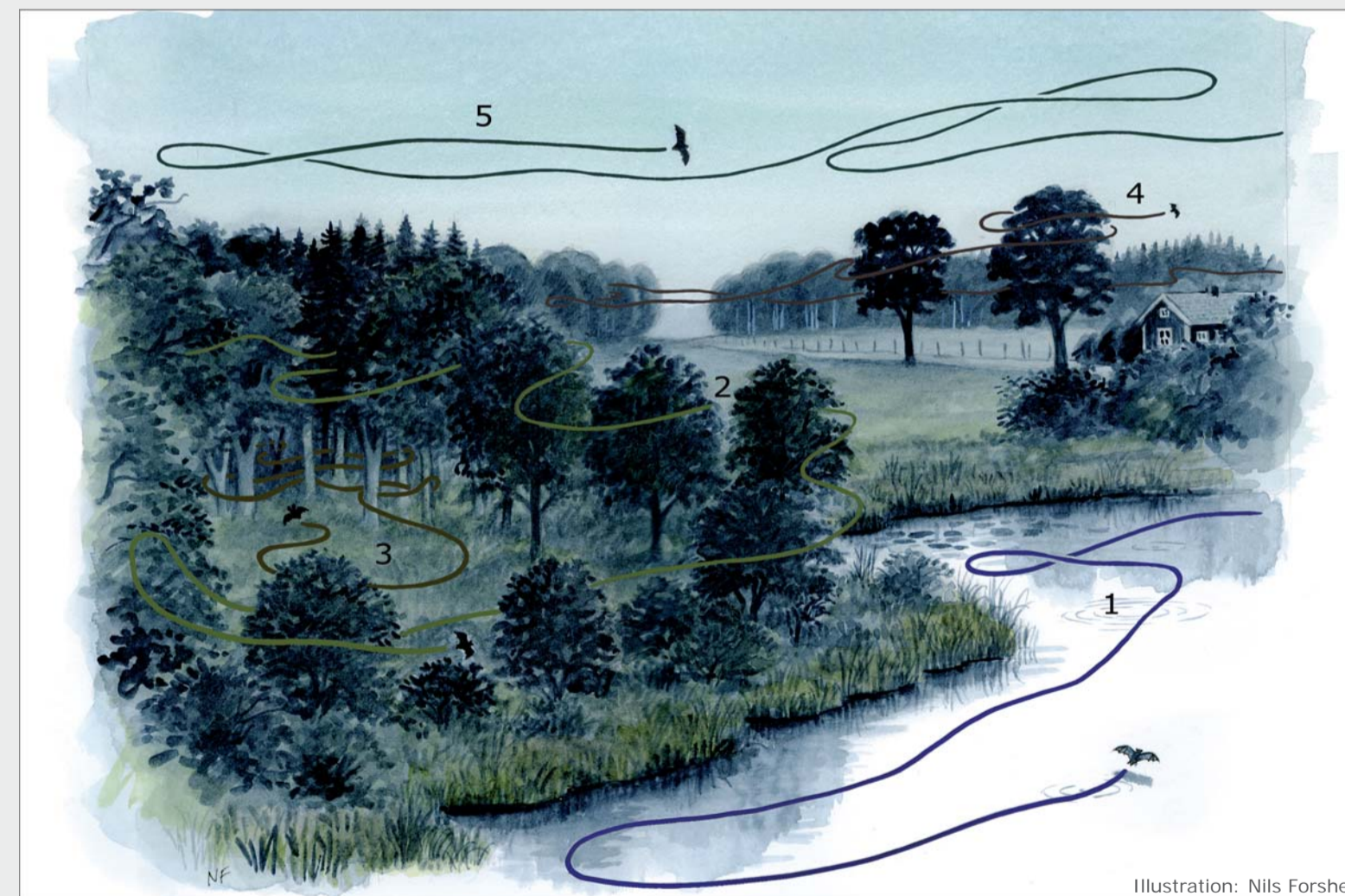
Illustration: Nils Forshed

Det är också viktigt att spara äldre, grova träd och hålträd.