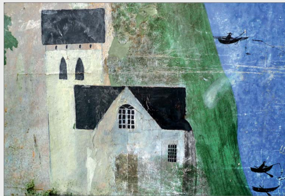
Finja kyrka hade bästa läge, vid sjökanten. "Måleböketapeten" visar kyrkoherden och kaplanen med fisk på kroken! Finns i Hässleholms Museum.

Här står du på gammal sjöbotten och vallen intill var strandkant. Vid högvatten översvämmades de sankna markerna runt sjön. Olika sorters gräs och örter frodades, det slogs som hö till djuren och strandängarna befriade sjön från överskott av näring. Sjön var rik på fisk, flodkräftor och andra smådjur och mängder av fåglar levde vid sjön och på strandängarna.