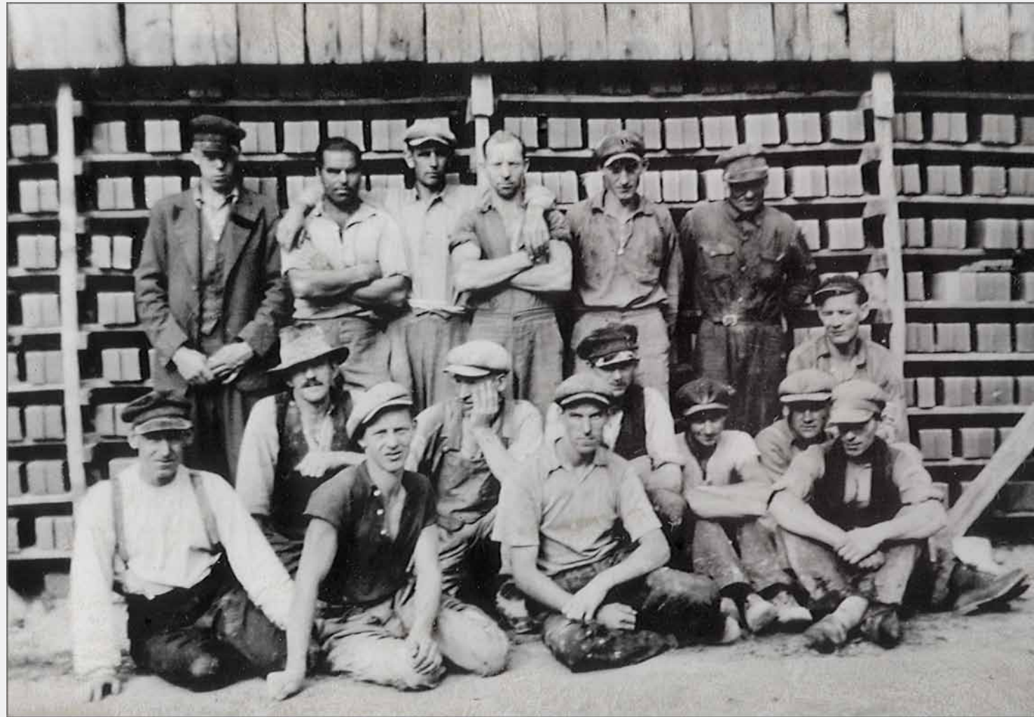
Arbetare vid tegelbruket i Sjöröd sommaren 1939. Normalt arbetade här 15 man under sommar och höst. På bilden har råsten staplats för torkning i en av ladorna.

Leran grävdes fram för hand och drogs upp med ett spel i vagnar på ett spår. Det blandades med sågspån och formades med hjälp av en maskin till tegel. Sågspånen gjorde teglet till innerväggar lättare. Det dög inte till fasad- eller skorstensmurning.