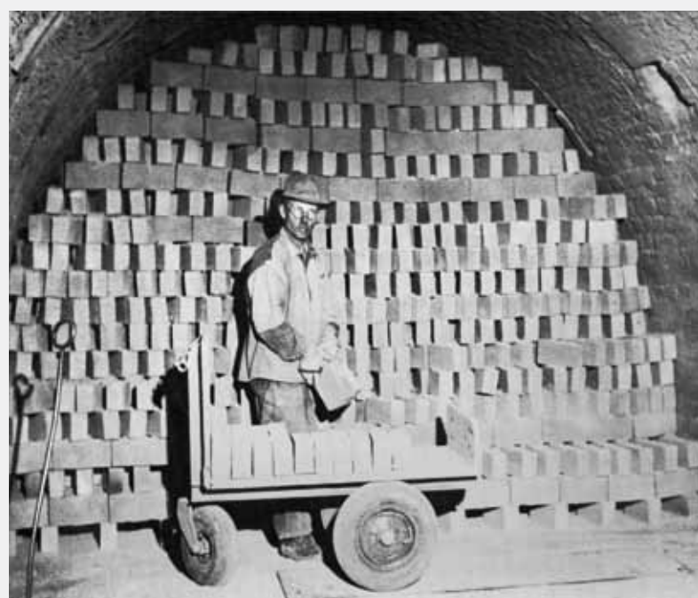
För bränningen hade man en ringugn med ansluten hög skorsten. Bränningen kunde ta upp till 14 dagar.

Leran grävdes fram för hand och drogs upp med ett spel i vagnar på ett spår. Det blandades med sågspån och formades med hjälp av en maskin till tegel. Sågspånen gjorde teglet till innerväggar lättare. Det dög inte till fasad- eller skorstensmurning.