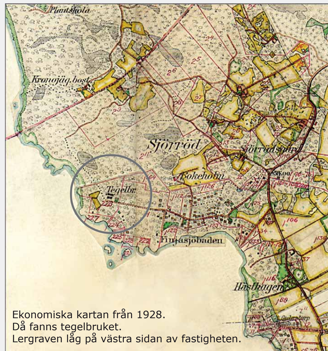
Ekonomiska kartan från 1928. Då fanns tegelbruket. Lergraven låg på västra sidan av fastigheten.

Det har funnits flera små tegelbruk runt Finjasjön. Äldst är nog Säljalt vid Hovdala, som troligen är från slutet av 1700-talet.