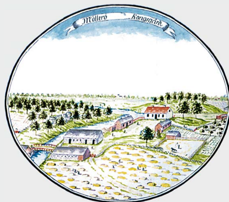
Mölleröd drogs in till Kronan 1680, blev kungsgård och senare ryttmästarboställe åt Norra Skånska kavalleriregementet. Gården hade stort jordbruk och i kronoskogen låg torpen tät. Akvarell från 1700-talets slut.