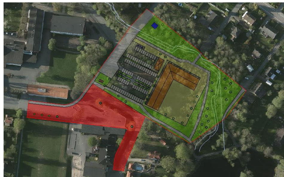
Illustration med möjlig disposition av planområdet. Röd = skolområde, Grön = park, Grå = parkering, Blå = teknisk anläggning, Brun = möjlig utformning på byggnad inom byggrätt.