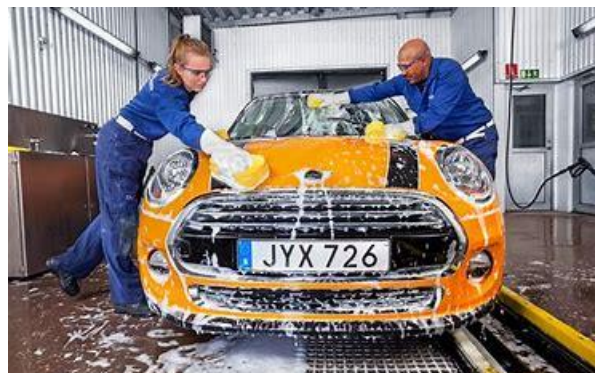
Jobb på biltvätt. Personalen tvättar bilar varje dag.

Jag vill göra samma saker på jobbet varje dag.