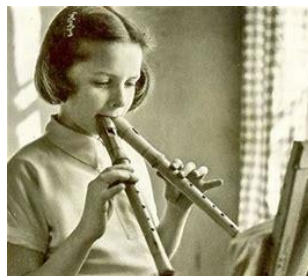
Flicka spelar flöjt

Det betyder repris och då ska man spela samma sak igen. I Coronatider känns livet så ibland. Varje dag är en repris av den förra. Det händer inte så många nya saker.