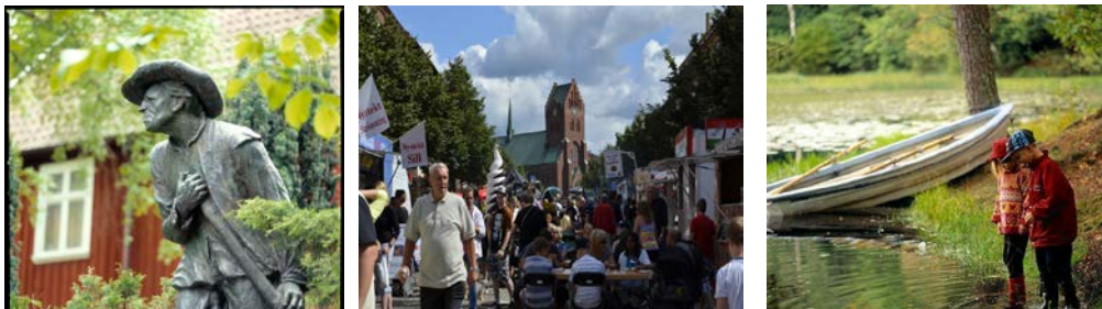
Snapphanen, Hässleholms hembygdpak