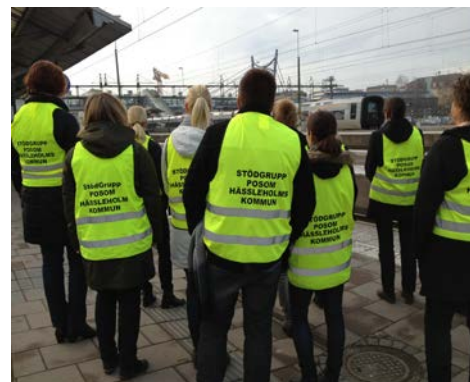
POSOM stödgrupp