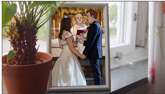
En av bilderna som tagits fram som diskussionsunderlag i projektet.

– Jag är väldigt stolt över hela materialet som jag tycker håller hög klass och som jag vet fungerar väldigt bra. Jag vet det därför att vi under hela projekttiden utvärderade materialet tillsammans med elever och lärare, men även för att den externa utvärderingen vi gjorde visade på det.