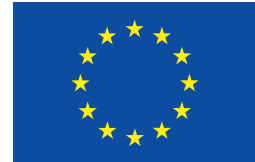
EUROPEISKA UNIONEN Asyl-, migrations- och integrationsfonden