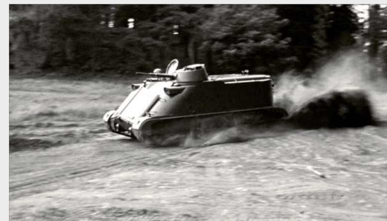
Pansarbandvagn 302 från 1960-talet. Ur Hässleholms museums samling.

När Hovdala blev pansarövningsfält för Kungliga Skånska pansarregementet (P2) år 1944 anpassades vägen efter de nya behoven. Du kan se partier med smågatsten som sattes där stridsvagnar skulle svänga. Gatsten minskar friktion och bevarar vägen bättre. Breda grusrampor i vägkanten är rester efter stridsbanor. Lagg märke till mittsträngen av svart diabas.