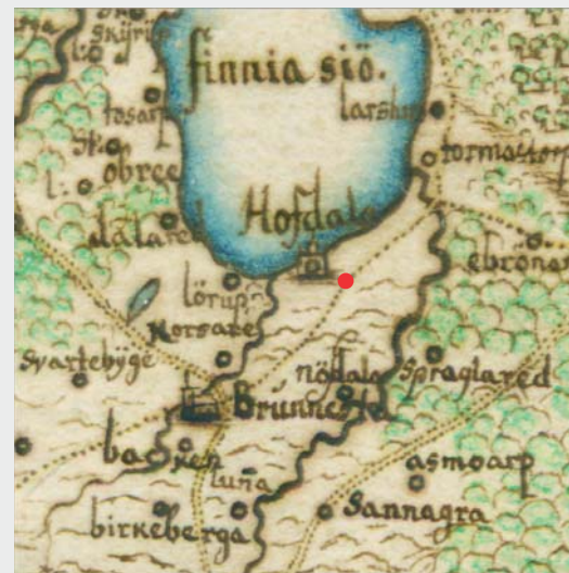
Buhrmanns karta från 1684. Det är den första kartan över hela Skåne som är hyfsat korrekt och detaljerad.

I slänten framför dig ser du en hålväg. Det är gamla vägen till Hovdala, kallad Gårdstalien. Den anslöt till medeltida byar i trakten, såsom Ignaberga, Brönnestad och Tormestorp. Gårdstalien var huvudväg ända fram till 1930-talet.