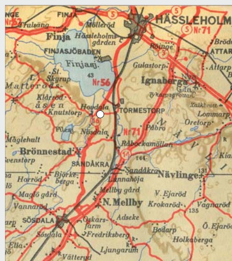
En bilatlas från 1948 visar den nya länsväg 56, som anlades på 1930-talet. En typisk AK-väg är rak med tvåa kurvor.

Vägen vid dina fötter, länsväg 56, är efterföljaren. Den gick mellan Hässleholm och Sösdala och byggdes av AK-arbetare, arbetslösa med nödhjulsarbete. Statens arbetslöshetskommission organiserade dessa efter första världskriget och sände ut en hel armé av arbetslösa. Med hackor och spadar anlade de tusentals vägar i Sverige.