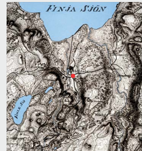
På Skånska rekognosceringskartan 1812-1820 syns den gamla vägen Gårdstalien. Följ vägen österut till Tormestorpsån och njut av den vackra bron.

När Hovdala blev pansarövningsfält för Kungliga Skånska pansarregementet (P2) år 1944 anpassades vägen efter de nya behoven. Du kan se partier med smågatsten som sattes där stridsvagnar skulle svänga. Gatsten minskar friktion och bevarar vägen bättre. Breda grusrampor i vägkanten är rester efter stridsbanor. Lagg märke till mittsträngen av svart diabas.