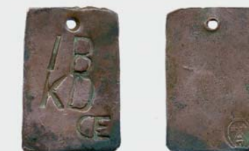
Pollett för: "Ett budat karldagsverke" med Hovdala-stämpel

Backstugan hade stampat jordgolvet och backen som stugvägg. 1870-talet - revs och blev ved 1945.