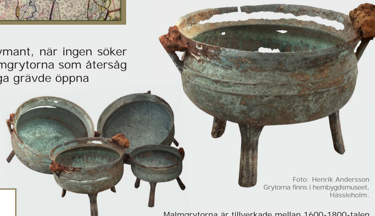
Grytorna finns i hembygdsmuseet, Hässleholm.

Närmare Lörup är det en kopparkittel med pengar du ska söka. Penga-eken som stod i backen och alla håligheter efter tidigare skattsökare är numera borta. Ryktet säger att några Lörupsbor lade beslag på skatten. Lyckas du få syn på den kommer en uppflygande höna eller annat fyle försöka skrämma dig.