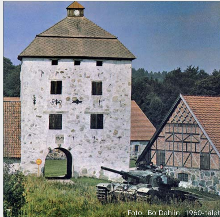
Stridsvagn 101 (Centurion) framför Hovdala slott.

En stor del av marken runt Hovdala slott var övnings- och skjutfält åt Kungl. Skånska pansarregementet (P 2, senare Skånska dragonregementet) mellan 1947 och 2000. I hela området hittar du rester – och kanske egna minnen från din värnplikt.