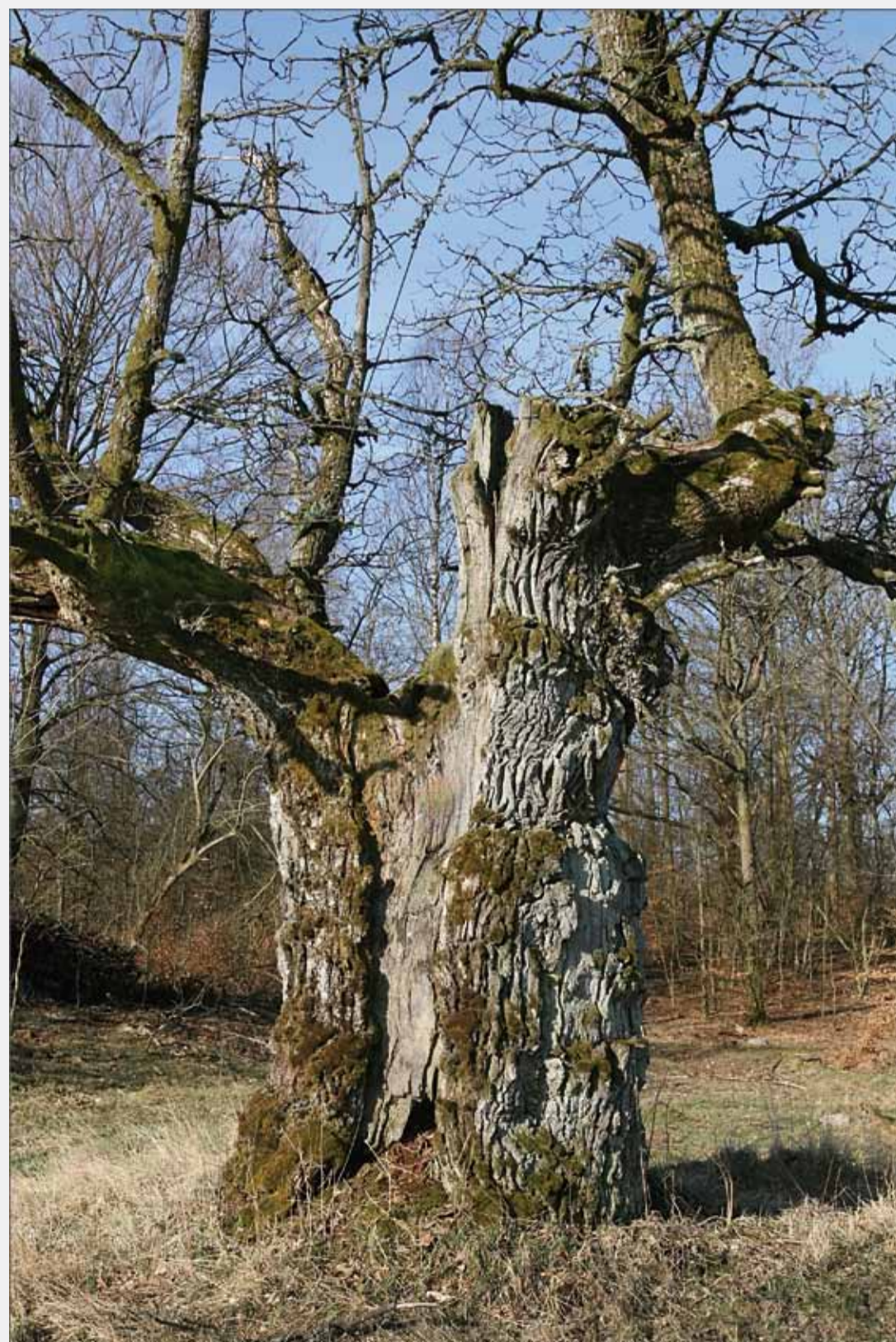
Felix ek, Maglö

Människan har i alla tider fascinerats av stora, gamla och grova träd. Stora och märkligt formade träd har ofta ansetts besitta magiska och läkande krafter.