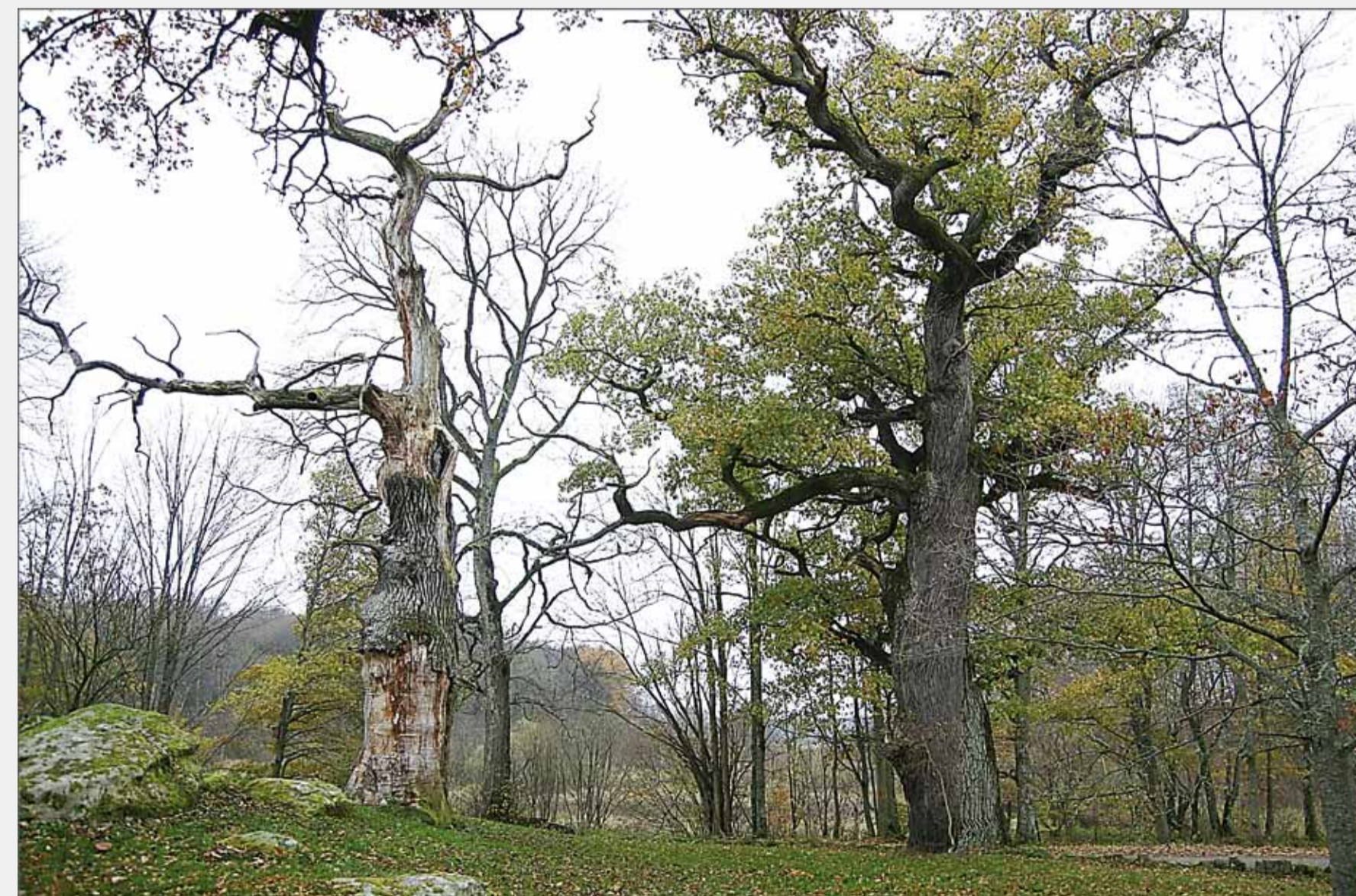
Ekar, Mölleröds kungsgård

Det moderna skogsbruket har utarmat landskapet på gamla, grova träd. Runt Finjasjön finns det dock gott om dessa, framför allt ek och bok. Inne i skogar hittar man ibland stora, spärrgreniga träd. Det är träd som tidigare stod mera öppet, ofta i en betad hagmark. Det kan vara viktigt att hugga fritt runt dessa för att få in ljus. Trädets livslängd ökar och vissa värmekrävande arter gynnas.