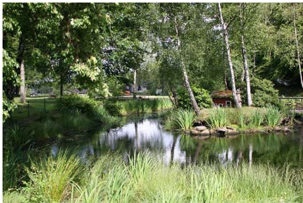
Parken vid Vannaröds slott, Sösdala.

Övrig tid via Larmcentralen, tel: 044-20 04 00.